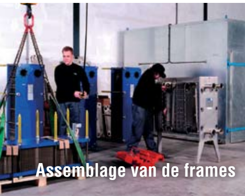
Assemblage van de frames